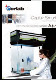
Smart Fume Hoods for your routine handlings