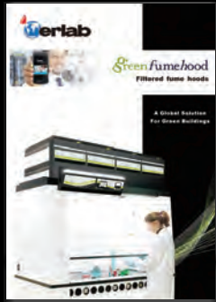
GreenFumehoods an alternative to ducted fume hoods