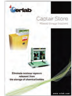
Captair Store Storage cabinets