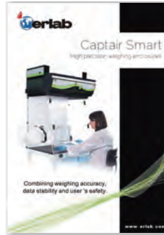
Captair Smart Weighing Stations