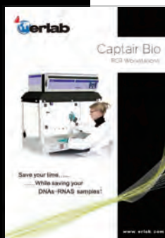
Captair Bio PCR Workstations