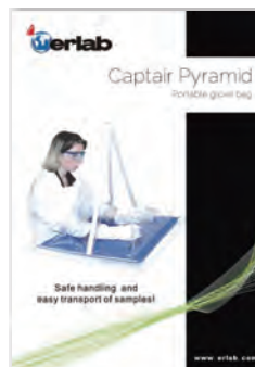
Captair Pyramid Portable Glovebox