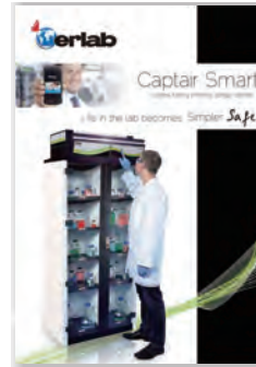
Captair Smart Storage cabinets