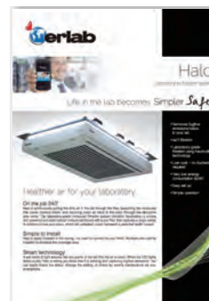
Halo Laboratory Air Filtration system