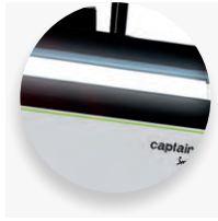
LED감박입과 경고음을 통한 알람