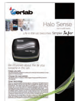
Halo Sense Lab Air Quality Sensor