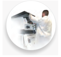
완벽한 사후 관리 서비스