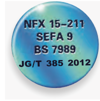
국제 안전 기준을 완벽히 준수