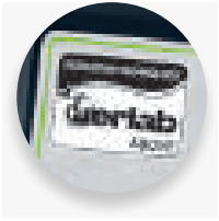
50년 된 Erlab의 케미컬 여과분야 전문성

스마트 기술: 신제품 Captair Smart 무다트 흡 후드는 간략하고 혁신적인 방식으로 현재 상태를 알리도록 설계 되어 있습니다. 스마트 기술은 라이트를 사용한 단순한 방법으로 후드가 안전하게 작동하고 있는지 알려주기 때문에 실험자가 실험에만 집중할 수 있습니다.